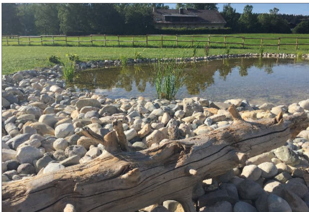
Tout espace naturel est destiné à devenir un abri pour de nombreuses espèces végétales et animales.